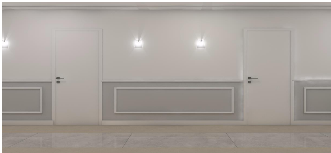
Imagem do Projeto para instalação dos rodameios:

propostos o desconhecimento de qualquer material/serviço para execução do objeto licitado.